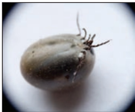
Oppsvulmet flått, omtrent så stor som en ert, full av blod, og ikke istand til å gå på vanlig vis.

Hver sommer hører vi om flått, en liten krabat som suger blod og kan overføre farlige sykdommer som hjernehinnebetennelse. Men hva er egentlig flått?