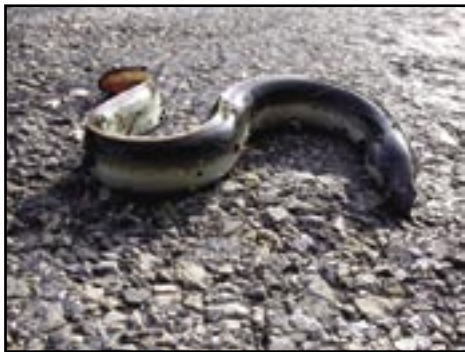
AKUTT TRUET. Ålen står i fare for å forsvinne fra norsk fauna. Den er truet over hele Europa. Den kan vandre over land når det er fuktig, og til og med krysse veier.