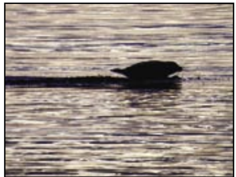
SÅRBAR. Steinkobben står på den nasjonale rødlisten og trues av utryddelse fra norsk fauna. Bildet er tatt i Råde.