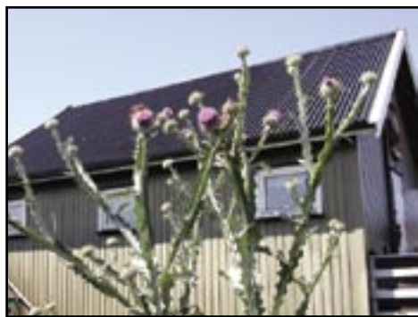
TUSSIS TISTEL. Eselstiselen har sitt eneste stabile voksetid i landet på Hvaler. I Sør-Europa har planten vært brukt til fôr og medisin for esler. Bildet er tatt på Herføl.

- Blant fylkets karplanter står 203 arter og underarter på rødlisten. Over halvparten av plantene på den nasjonale listen er funnet i Østfold. Også her ligger vi topp i landet. En lang rekke truede planter finnes kun hos oss, sier Hardeng.