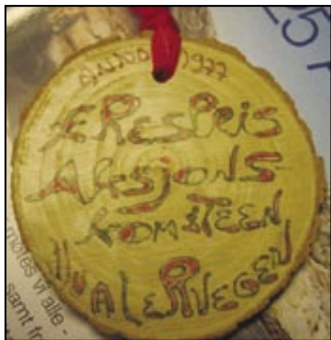
En av de mer kuriøse utmerkelser Tomy Syversen har mottatt er denne for sitt engasjement i forbindelse med fastlandsveien.

de første årene, unektelig fastlandsveien, veien som endret Hvalersamfunnet.