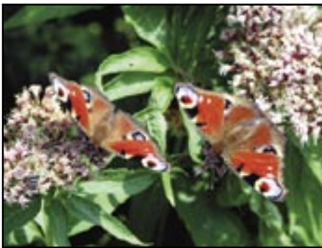
PÅ SJELDEN OG TRUET PLANTE. Hjortetrossen er en favorittplante for mange sommerfugler, som dagpågfløyen. Bildet er tatt på Hvaler.

Men ikke alt går den gale veien. Det finnes lyspunkter, især blant dyreartene. Hubro og vandrefalk er fortsatt sjeldne, men de øker i antall. Fiskeørnen ble fredet i 1962, og har nå god bestand i fylket. Ifølge rådgiver Hardeng. Vern har gitt positive resultater.