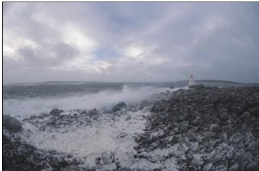
Brattestø en stormfull vinterdag.