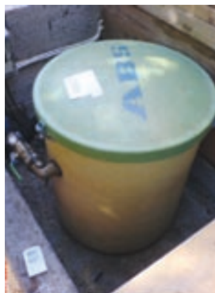
Bilde viser en kvernpumpe som ofte blir benyttet på hyttene i forbindelse med vann og avløp.

Da noen allerede har gjennomført et slikt vann- og kloakkprosjekt, eller har kommet langt i sine forberedelser til et prosjekt, har vi i Hvaler Hytteforening sett fordelene av å kunne gjenbruke de erfaringer og papirarbeid som allerede er gjort. Det er som kjent ikke nødvendig å finne opp hjulet på nytt hver gang! Vi har også bidratt økonomisk til utarbeidelse