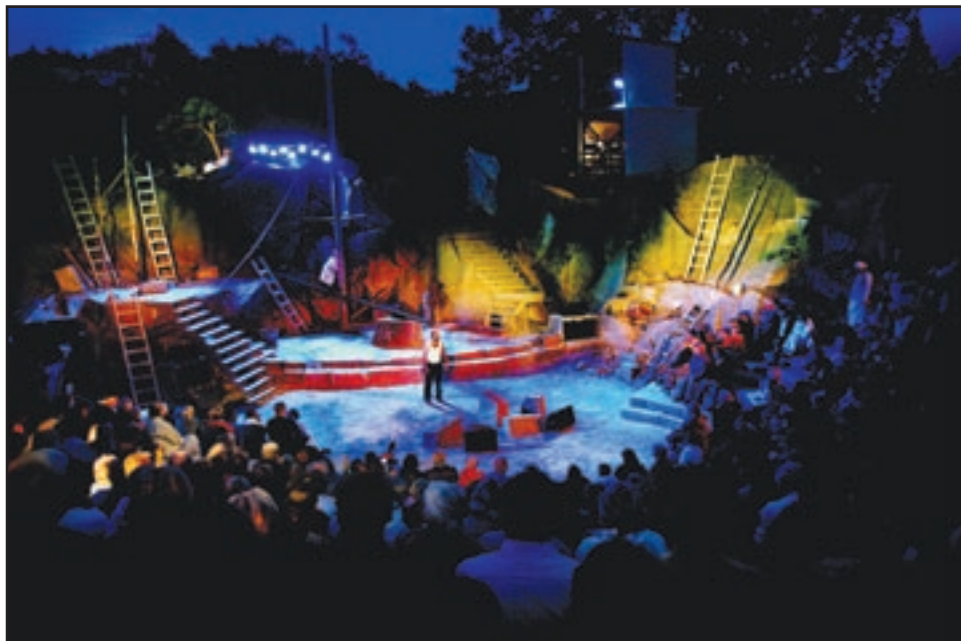
Bildet er fra premieren for musikkspillet «Stenhogger'n» i Brottet 2005.