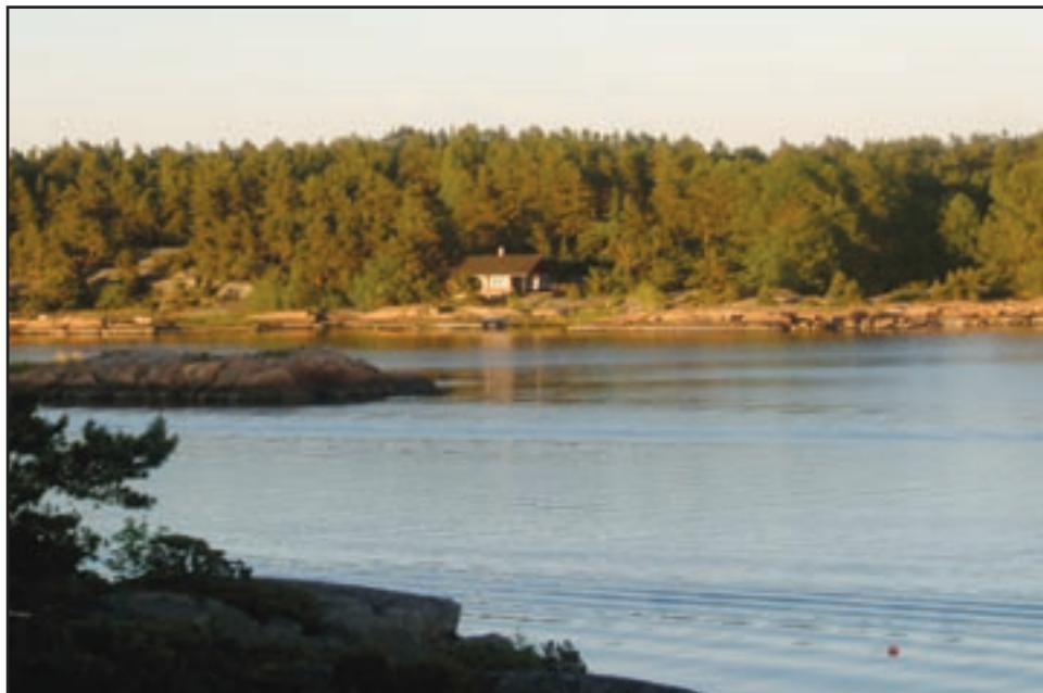
Furuholmen, hvor hytteeierne nå har mulighet til å bli medlem av Hvaler Hytteforening.

vervekampanje. I håp om flere medlemmer er denne utgaven sendt til samtlige hytteeiere i Hvaler kommune. Opplaget ble da på nesten 5000 eksemplarer, over dobbelt så mange som ved en vanlig utsendelse. Det ble også spurt om hvorfor posten driftkostnader var redusert til nesten halvparten. Kristoffersen opplyser at dette bl.a. skyldes reduserte utgifter til en serviceavtale på en kopimaskin som ikke lenger er i foreningens eie.