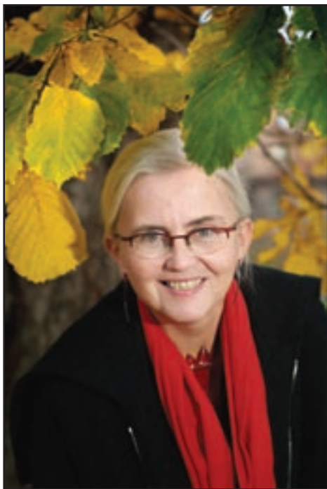
Miljøvernminister Helen Bjørnøy