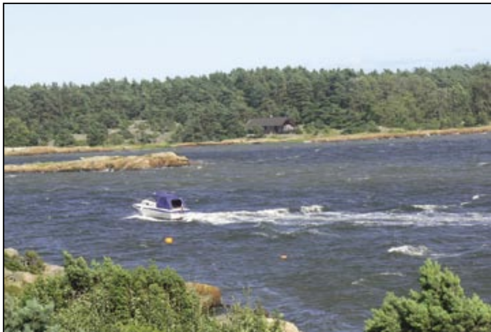
Båttrafikken i sommer var langt mindre enn i fjorårets feriemåned. Det dårlige været varr nok årsak til dette. Den dagen ovenstående bilde ble tatt, tok sjøen både båter og brygger.

Det var ingen debatt til forslaget, dette ble så tatt opp til avstemming. Forslaget ble enstemmig vedtatt.