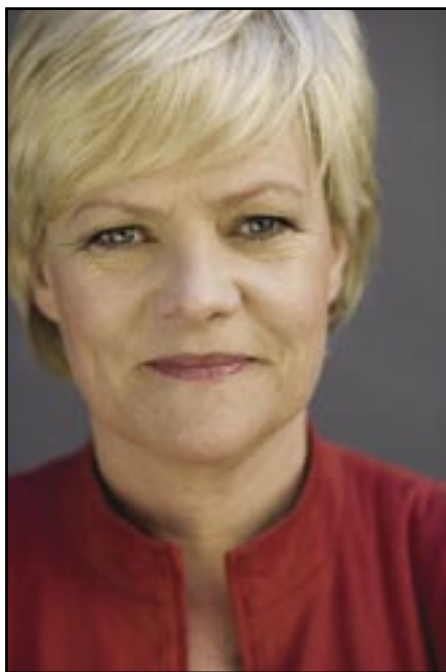
Finansminister Kristin Halvorsen.

og som ikke er tatt opp igjen til vurdering sett i lys av endringene i tomtefesteloven de siste år. Tolkningen fra 1992 har vært at hovedregel er at grunneier skal betale eiendomsskatt, ikke fester, men at det kan gjøres unntak dersom fester og grunneier har blitt enige om annet, eller om feste-forholdet gjelder for mer enn 99 år, eller om fester har ensidig rett til å forlenge avtalen uten tidsbegrensning.