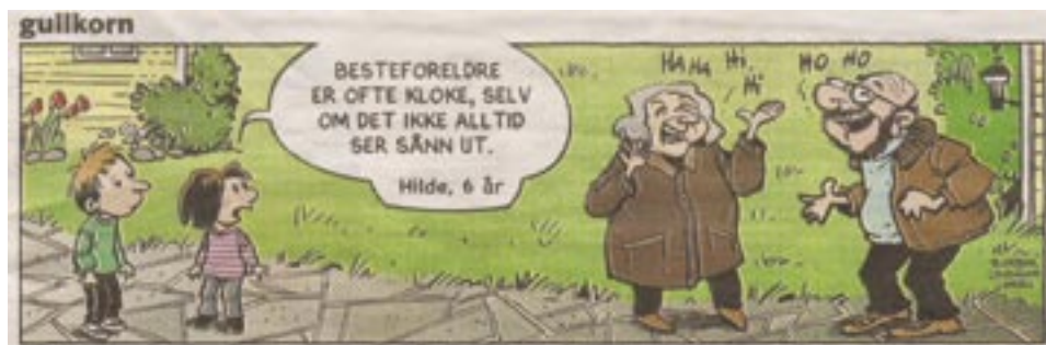
Ovenstående gullkorn er en faksimile fra Fredriksstad Blad 24. februar 2008.

Denne artikkelen er tidligere presentert i bladet Hytte & Fritid nr. 4. 2007, og gjengitt her etter tillatelse fra bladets redaksjon.